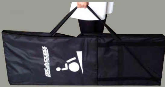
Sac* et poignée Un sac et une poignée pour un transport facile